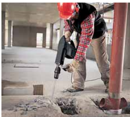
Idealan za rušenje i proboje.