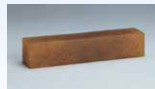
Čistač trake za brušenje Art.-Nr 0893 01