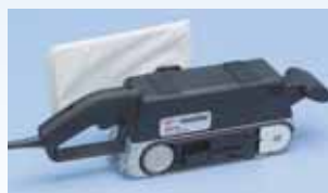
Ručna trakasta brusilica HBS 533 Art. -Nr. 0702 588 1

301, 305, 306, 309, 310, 311, 314, 316, 317, 318, 319, 350, 506, 507, 508