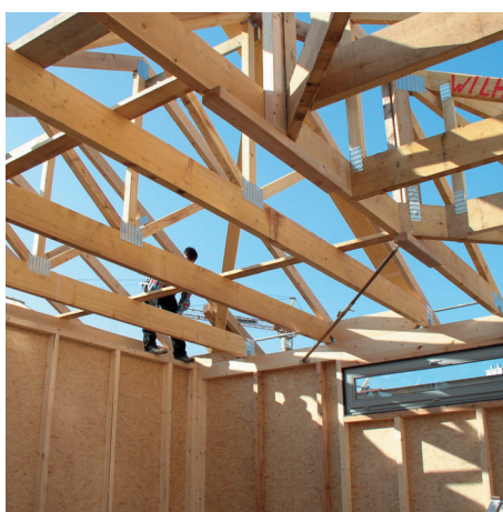
Gradnja od drveta / krovnna stolica