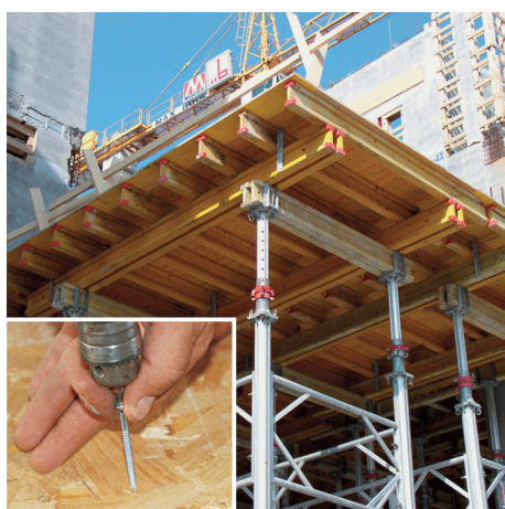
Postavljanje oplate (šalovanje)

Čelik kaljeni, pocinčani, žuto pasivirani.