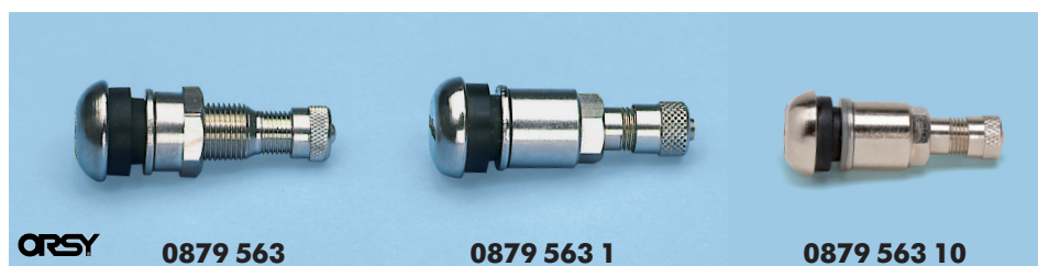
ORSY 0879 563 0879 563 1 0879 563 10