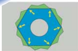
Bez POWERDRIV® linijski pritisak