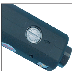
Integrisani regulator za podešavanje brzine