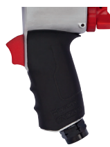
Ergonomski, gumom obloženi rukohvat i 360°-okretni ulaz zraka.