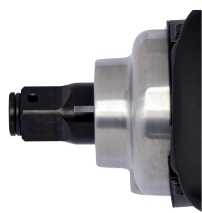
Prolazna rupa u 1"-četverougaoom pogonu za sigurnosnu čiviju.