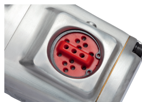
360°-okretni ispuh zraka smješten na gornjoj strani pneumatskog udarnog zavrtača. Ispušni zrak se može izbacivati u željenom pravcu.