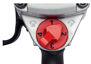
Prebacivanje smjera obrtanja i četiri stepena momenta pritezanja omogućuju optimalno prilagođavanje odgovarajućoj primjeni.