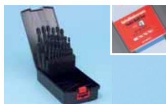
Sadržaj: Ø 1,0-13,0x0,5 mm, 25-djelni Art.-Nr. 0634 6 Pak./kom. 1 Prazna kasetna (nepopunjena) Art.-Nr. 0633 6 Pak./kom. 1