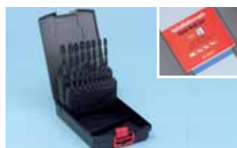
Sadržaj: Ø 1,0-10,0x0,5 mm, 19-djelni Art.-Nr. 0634 4 Pak./kom. 1 Prazna kasetna (nepopunjena) Art.-Nr. 0633 4 Pak./kom. 1