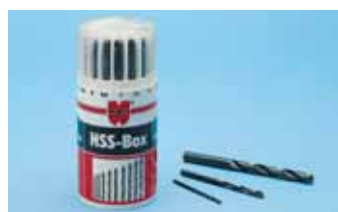
Sadržaj: Ø 1,0-10,0x0,5 mm, 19-djelni Art.-Nr. 0625 01 Pak./kom. 1