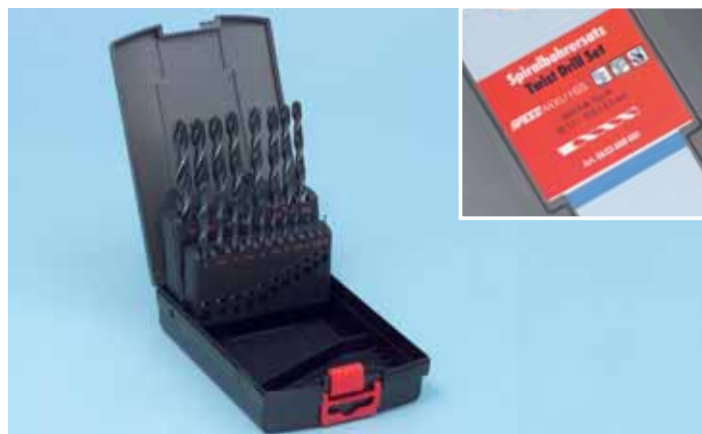
Sadržaj: Ø 1,0-10,0x0,5 mm, 19-djelni Art.-Nr. 0623 000 001 Pak./kom. 1