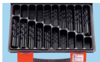
Sadržaj: po 10x Ø 1,0-6,0 x0,5 mm, po 5x Ø 6,5-10,5 x 0,5 mm, 155-djelni Art.-Nr. 0964 625 020 Pak./kom. 1 Prazna kasetna (nepopunjena) Art.-Nr. 0955 150 120 Pak./kom. 1