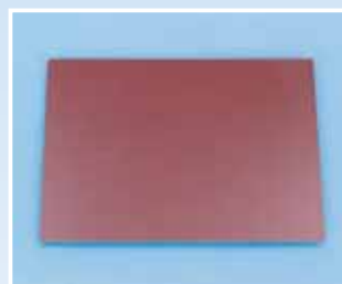
Ciljna ploča Art.-Nr. 0714 640 612