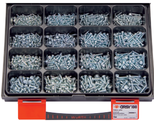
ORSY® 100 asortiman Art.-Nr. 0964 206 0

Sadržaj: Lećasta glava 1.600 ZEBRA® pias® sa AW® prihvatom 0206 35 95/13/16/19 0206 39 13/16/19/25 0206 42 13/16/19/25 0206 48 13/16/19/25