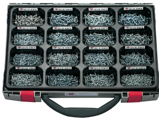
ORSY® 200 asortiman Art.-Nr. 0964 252 060

4 bit-umetka 1/4" 1x AW 10, Art.-Nr. 0614 511 0 2x AW 20, Art.-Nr. 0614 512 0 1x AW 25, Art.-Nr. 0614 512 5