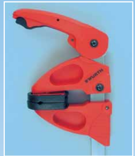
Stega se u sekundi može stegnuti...