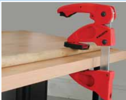
Zaštitne čeljusti sa V utorom služe za sigurno stezanje okruglih materijala.