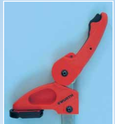
i ponovo otpustiti