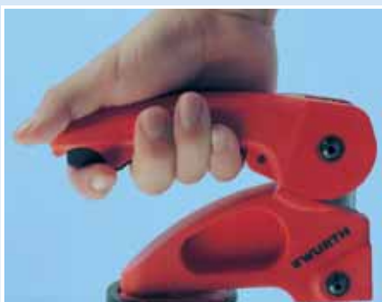
Pritiskom na crno dugme otpušta se ručica stege.