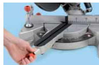
Brzo podešavanje standardnih kosih rezova pomoću fiksne podjele.