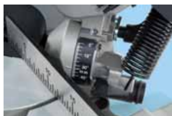
Izvlačenjem graničnog vijka ugao nagiba se može povećati i do 48°.