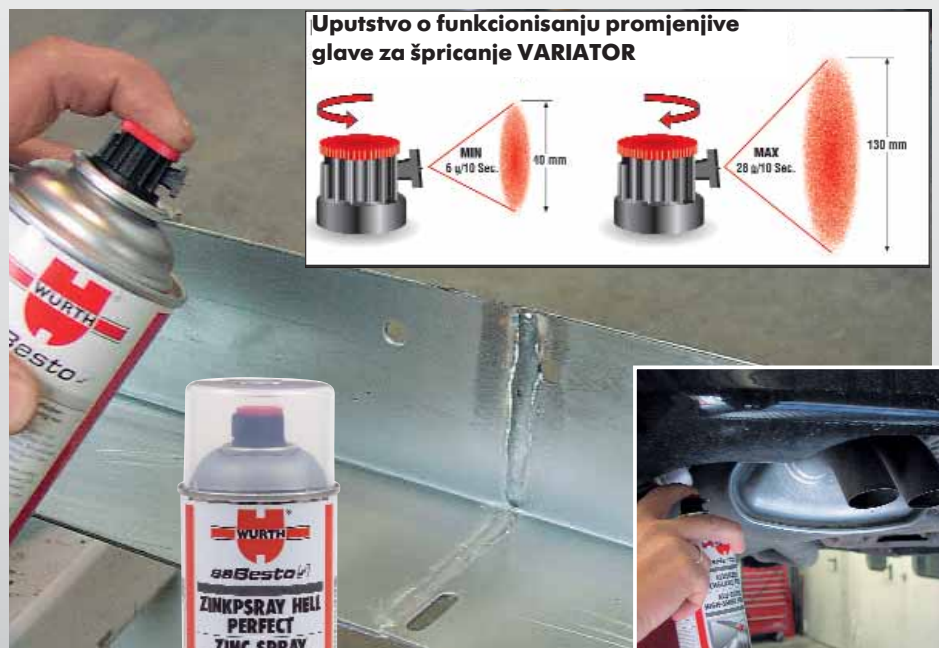
Uputstvo o funkcionisanju promjenjive glave za špricanje VARIATOR

Odlična dugotrajna zaštita i optimalan izgled metalne površine