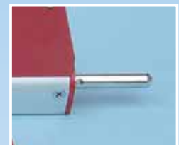
Obje strane sa mjernim trnovima