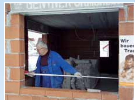
Za horizontalno mjerenje