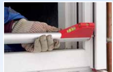
Za mjerenje u vodilicama roletni