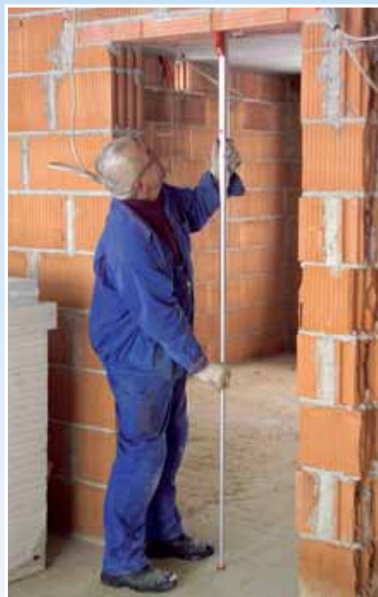
Za vertikalno mjerenje