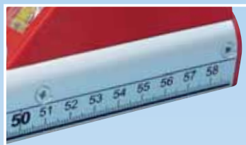
Podjela na kućištu