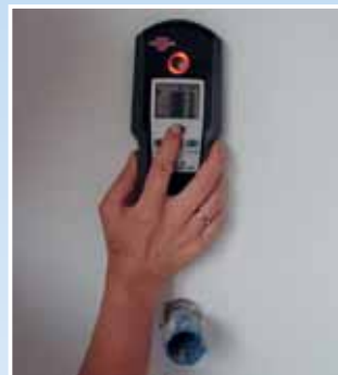
Lociranje vodovodnih cijevi (bakar)