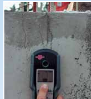
Lociranje željeznih armatura