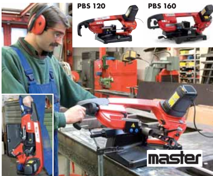
Laka za transport.