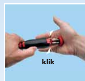
Sigurno zatvaranje pomoću „zabavljivanja“.