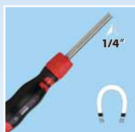
Magnetni prihvat na oštrici za 1/4"-bits