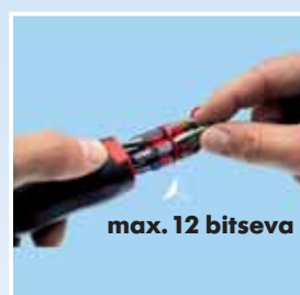
Jednostavno izvlačenje željenog (potrebnog) bitsa.