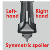
Simetričan spojler Flatblade smart