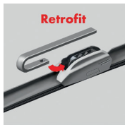
Retrofit Flatblade smart