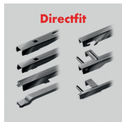
Directfit Flatblade smart