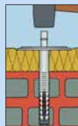
Zakucati ekspanzioni klin