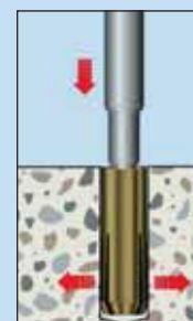
Pričvrstiti tiplu pomoću alata