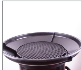
Ekscentrični lijevak – prihvatna posuda za ulje