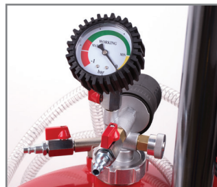
Manometar + venturi grupa