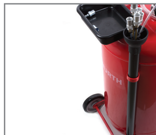
Set sondi + posuda za dijelove