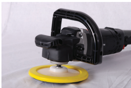
Pomoćni D-rukohvat za udobniji rad