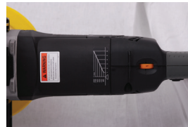
Potencijometar i tablica za izbor odgovarajućeg broja obrtaja