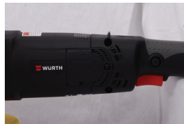
Poklopac za brzu zamjenu grafitnih četkica